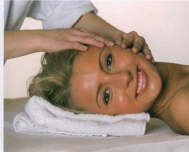
... nicht nur, wenn es um Lebensmittel geht.

brauch eingeführt ist. Wenn man von LOHAS spricht, dann spricht man weder von einem Modetrend noch von einer homogenen Zielgruppe. LOHAS definiert eine Gruppe von Menschen, die es sich leisten kann und will, auf die eigene Gesundheit zu achten und nachhaltig einzukaufen. Es ist zu