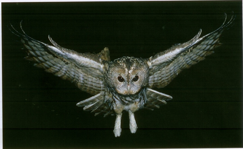
... im Einklang mit der Natur.

Coop hat in der Schweiz in hohem Masse zur Verbreitung von LOHAS beigetragen. Bei Coop ist die Nachhaltigkeit nicht nur in den Richtlinien und Statuten festgeschrieben, sie wird auch angewendet. So schreibt Coop auf seiner Homepage, dass der Konzern bis 2023 in allen direkt beeinflussbaren Bereichen CO 2 -neutral werden will. Mit diversen Bio-Labels, allen voran die Labels «Naturaplan, Naturaline und Oecoplan», hat Coop das Konsumentenbewusstsein und so auch das Einkaufsverhalten extrem verändert. Gleichzeitig wurde die Nachfrage für Bioprodukte grösser. Demzufolge stellten viele Schweizer Bauern auf Bio um. Coop achtet aber auch auf die Biodiversität und fördert so die Artenvielfalt und damit die regionalen Spezialitäten. Selbst die Produkte von «ProSpecieRara» findet man bei Coop. Dadurch gelingt es, in Vergessenheit geratene Pflanzensorten und Haustierrassen wieder populär zu machen. Mit seinem Engagement für Massensport