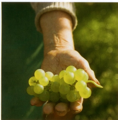
Nachhaltigkeit ist bei LOHAS von grosser Bedeutung.