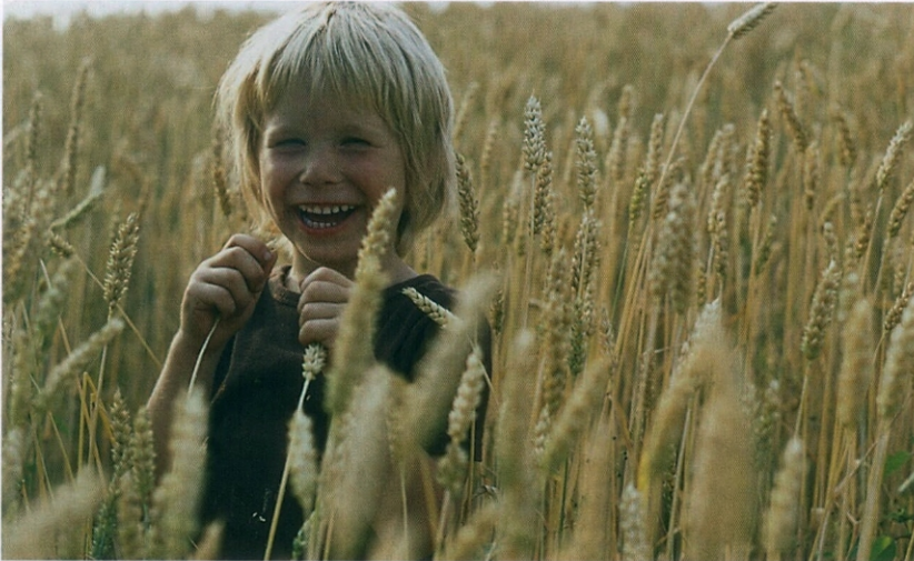
LOHAS heisst auch, bewusst konsumieren ...

der Schweiz dem US-Markt ebenbürtig ist. Mit der «Lifefair» gibt es in Zürich in diesem Jahr bereits zum dritten Mal eine LOHAS-Messe. Die Messe bezeichnet sich als Messe für Nachhaltigkeit und «green lifestyle». Auch daran sieht man, wie wenig das Akronym LOHAS in unserem Sprachge-